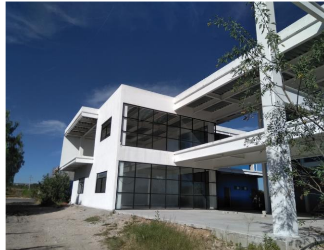
F1: Fachada principal