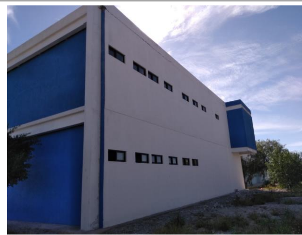
F3: Fachada lateral oriente