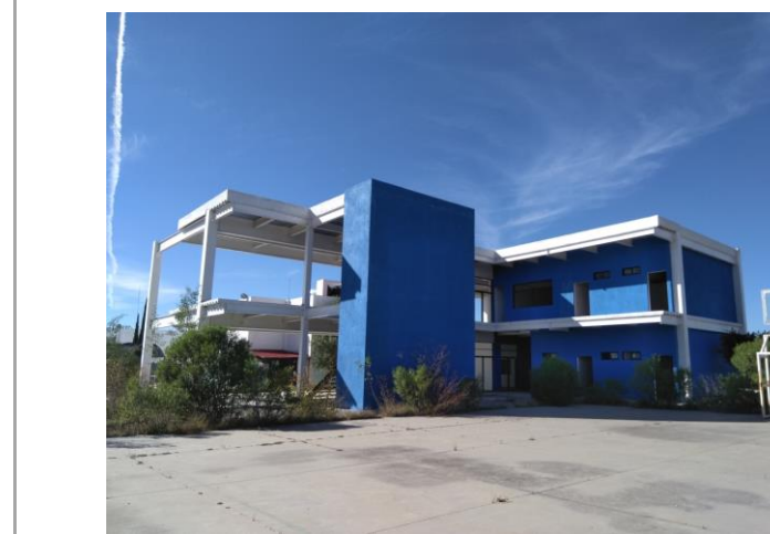
F2: Fachada lateral poniente