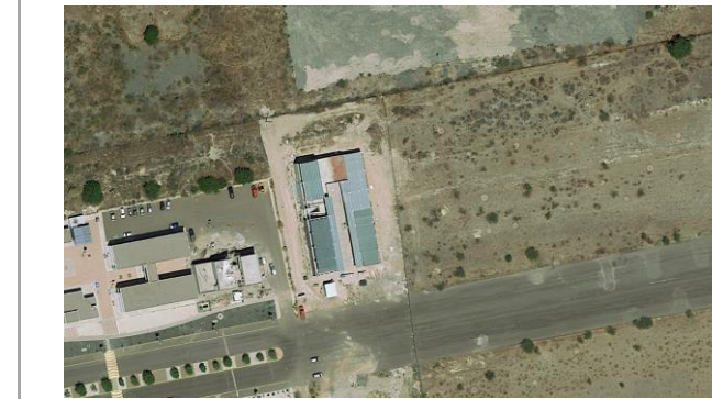
Referencia de fotos en croquis