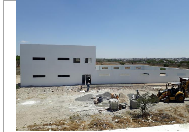
F2: Fachada lateral poniente