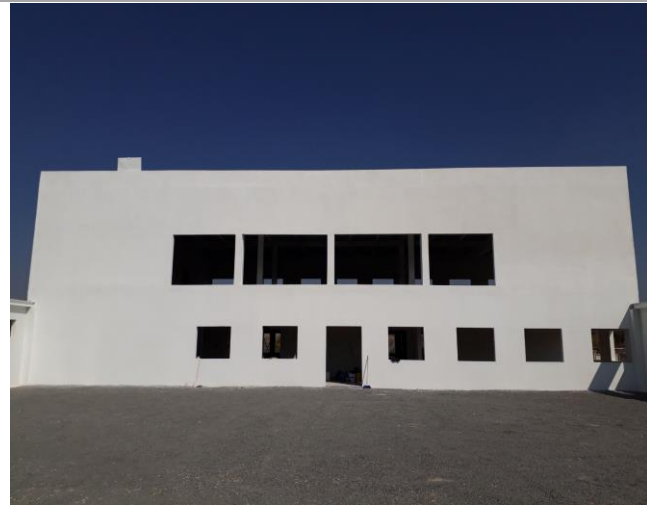
F1: Fachada principal