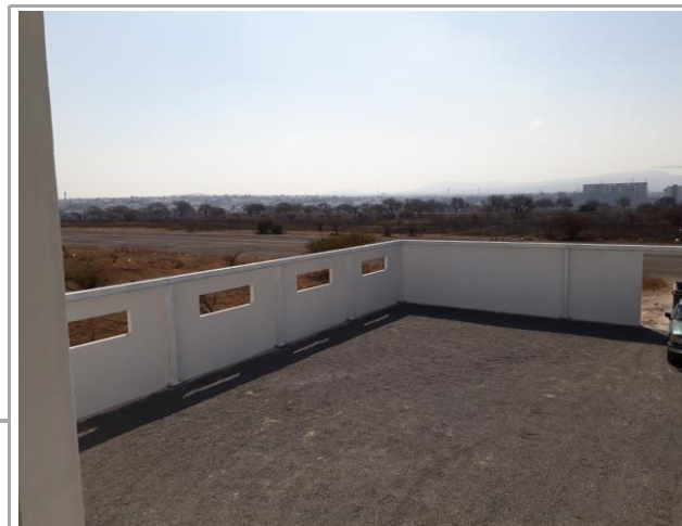
F3: Fachada lateral oriente