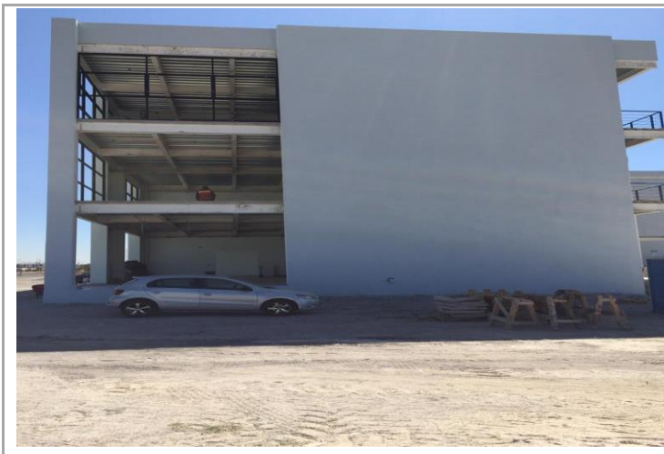
F4: lateral Derecha