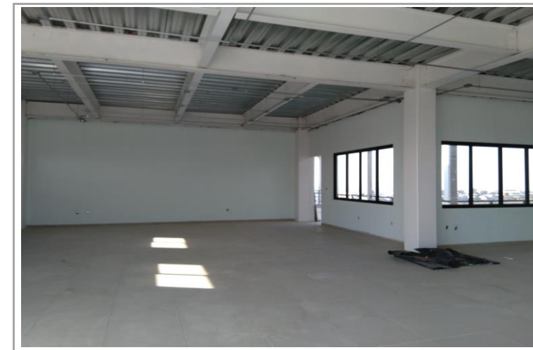
F5: Interior de aula Planta Alta