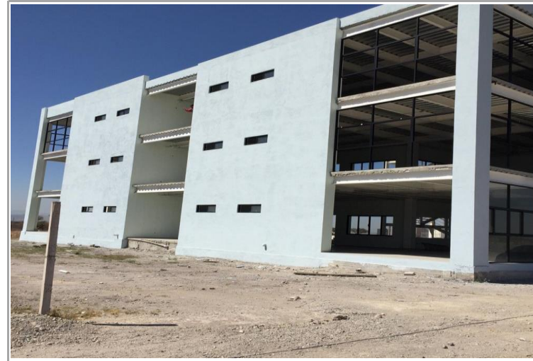
F2: lateral Izquierda