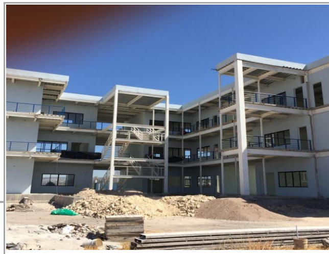
F3: Fachada posterior