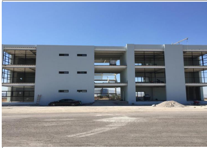
F1: Fachada principal