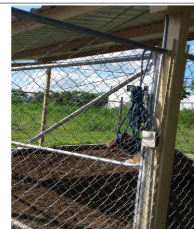
F5: Interior de aula