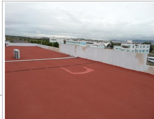
F3: Fachada posterior