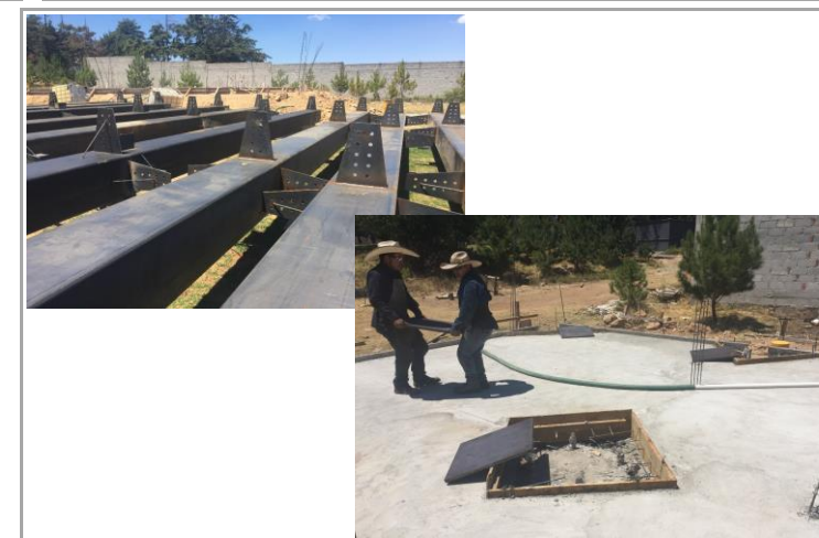
F5: Habilitado de vigas en general