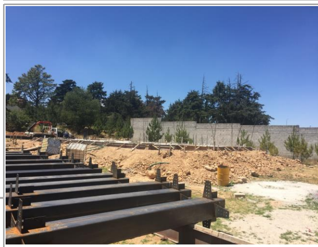
F3: Fachada lateral oriente

Comentarios de los trabajos realizados: "CENTRO DE INVESTIGACION PARA EL CAMPUS DE AMEALCO, UNIVERSIDAD AUTONOMA DE QUERETARO" CONTRATO: CAAS-OB-037-2018-UAQ-OAG Porcentaje de Avance físico: 100% Los trabajos contratados ya se se encuentran concluidos.