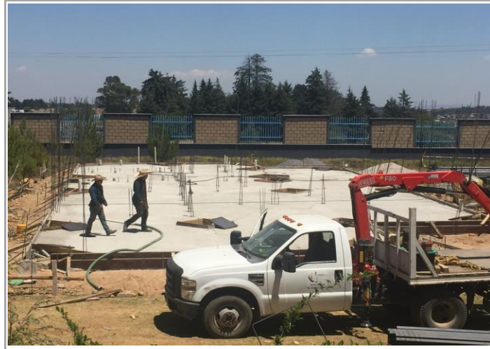
F1: Fachada principal