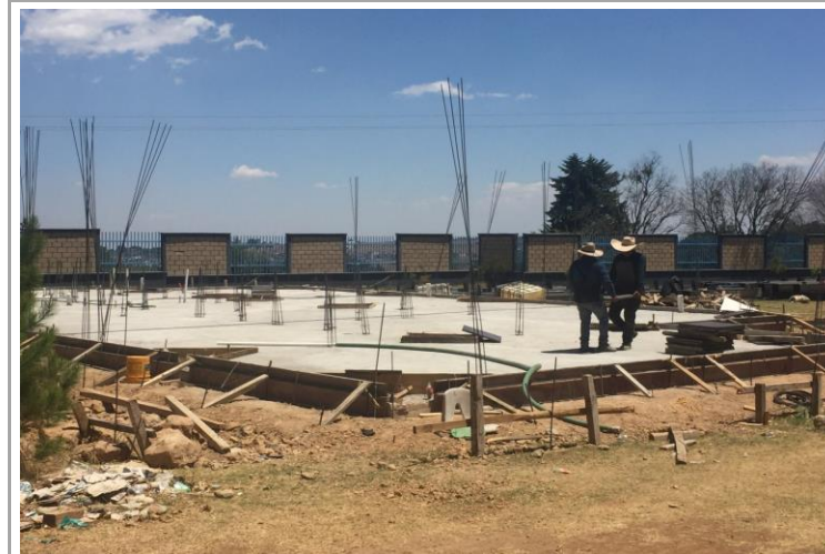
F2: Fachada lateral poniente

Comentarios de los trabajos realizados: "CENTRO DE INVESTIGACION PARA EL CAMPUS DE AMEALCO, UNIVERSIDAD AUTONOMA DE QUERETARO" CONTRATO: CAAS-OB-037-2018-UAQ-OAG Porcentaje de Avance físico: 100% Los trabajos contratados ya se se encuentran concluidos.