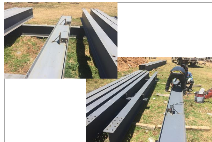
F4: Vigas con primer anticorrosivo