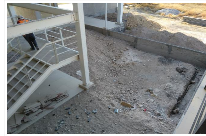
F5: Vista al interior