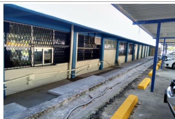
F3: Complemento de instalacion electrica y pintura en muros interiores.

SE REALIZÓ LA CONEXIÓN SANITARIA DE LOS BAÑOS DE LA PLANTA ALTA.