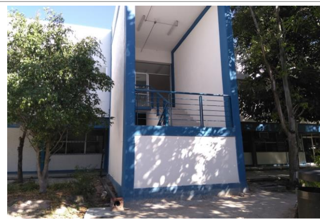
F1: Colocacion de barandal y pintura.