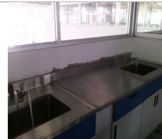
F5: Interior de aula