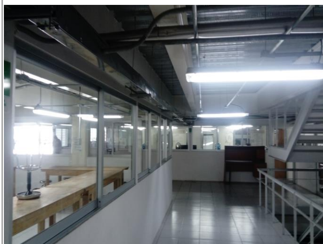
F1: Fachada principal