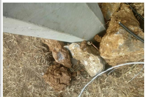
F3: Fachada posterior

En la foto F1, se observa la colocación de herrajes y sujeciones de los postes, por medio de cable anclados al suelo y la colocación de cable por vía aérea. En la foto F2 se observa la llegada al otro poste por vía aérea y la sujeción de poste a poste. En la foto F3, se observa la colocación de la tierra física.. En la foto F4, se observa la colocación de herrajes y sujeciones de los postes, por medio de cable anclados al suelo y la colocación de cable por vía aérea. En la foto F5 se observa la conexión de un accesorio para control de luminarias en los corrales y un contacto. Cada corral tiene un accesorio..