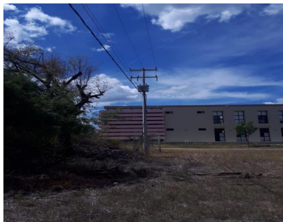
F1: Fachada principal