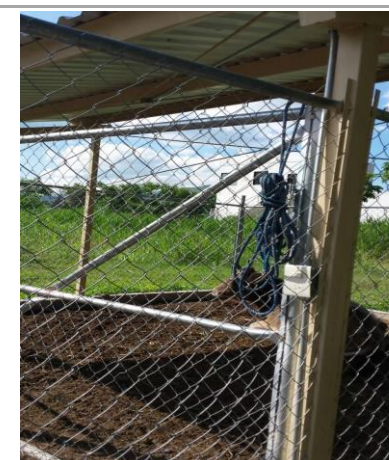
F5: Interior de aula