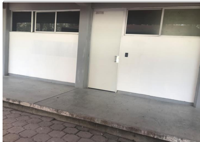
F1: Fachada principal