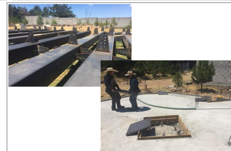
F5: Habilitado de vigas en general